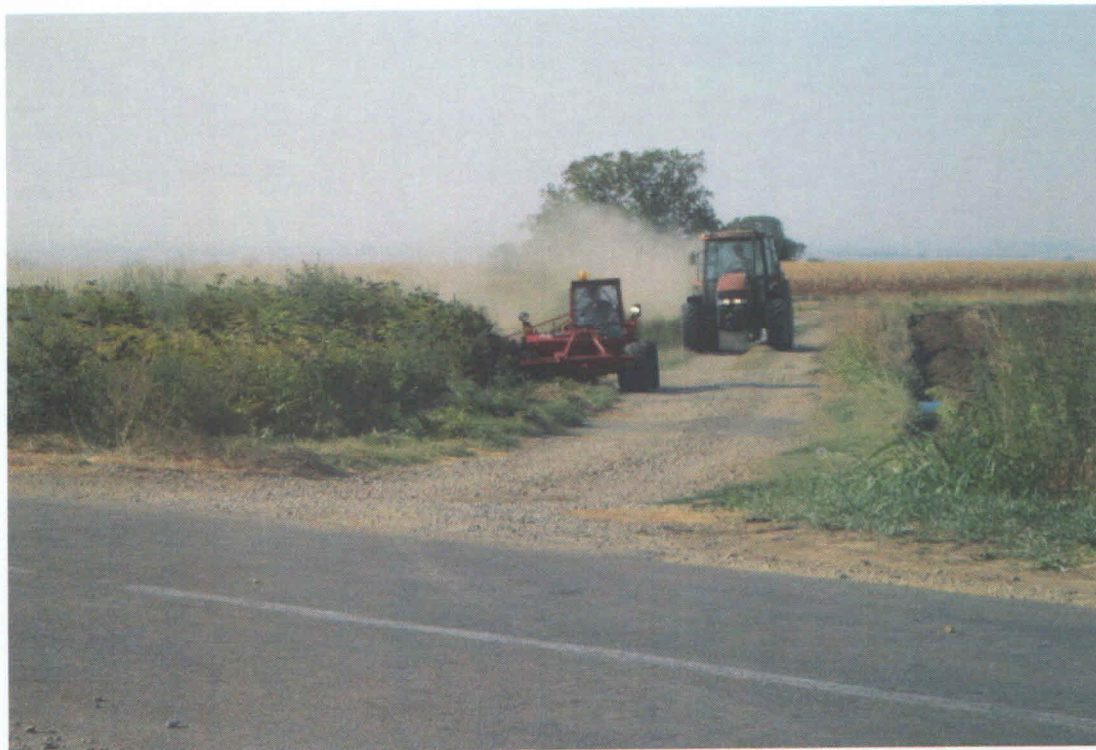
Slika 7. Mehaničko suzbijanje ambrozije – ručno i mašinsko košenje