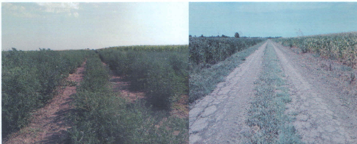
Slika 10. Tretiman suzbijanja ambrozije - pre i posle tretmana

Infestacija ambrozijom bila je koncentrisana na lokalne i atarske puteve, obodne delove naseljenih mesta, divlje deponije, površine uz kanale kao i površine koje nisu namenjene poljoprivredi. U većem obimu vršeno je mehaničko suzbijanje ambrozije čija je fenofaza razvoja na većini lokacija bila adekvatna za tretman mehaničkim suzbijanjem.