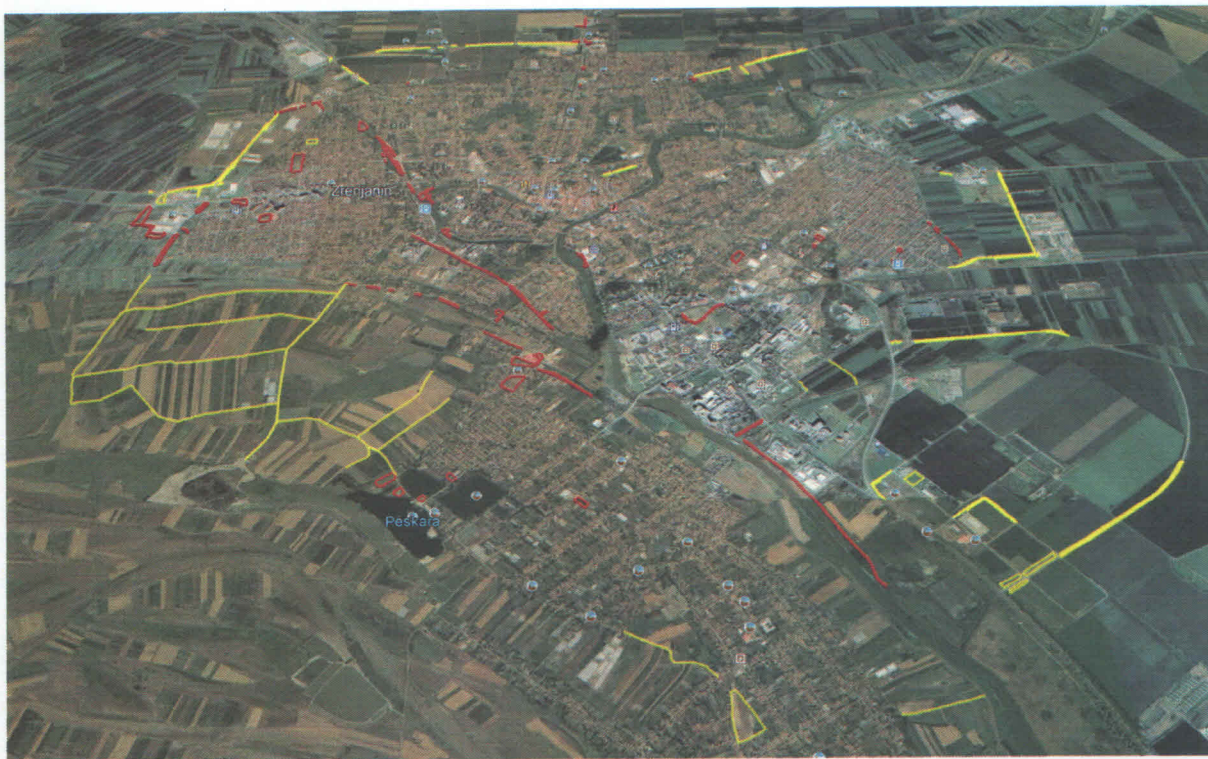
Slika 2. Ucrtane lokacije za košenje Grada Zrenjanina u GIS softver Ciklonizacije A.d

Daljinska detekcija prostorne rasprostranjenosti ambrozije je sprovedena na 5 lokacija. Snimanje je sprovedeno 07.08.2018 godine iz helikoptera sa visine 400 metara od tla. Raspored dobijenih snimaka prikazan je na Slici 3. Površina sva tri snimljena lokaliteta iznosi 6.000ha.