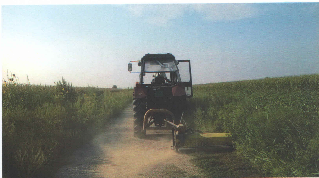
Slika 9. Mehaničko suzbijanje ambrozije –mašinsko košenje