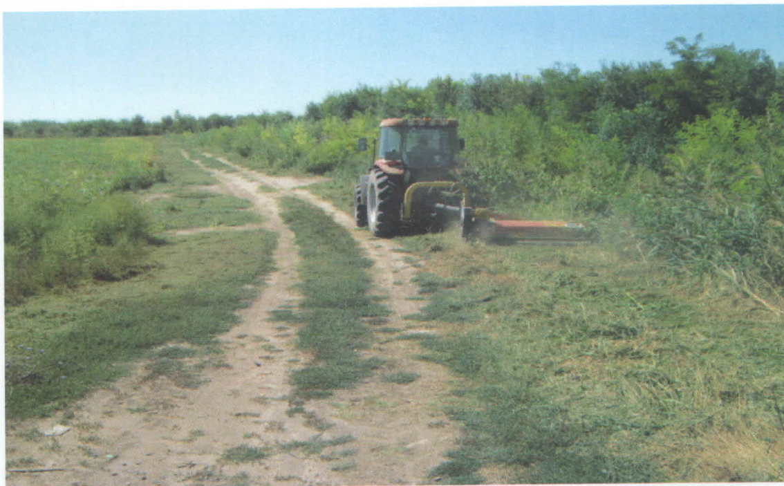
Slika 6. Mehaničko suzbijanje ambrozije – ručno i mašinsko košenje