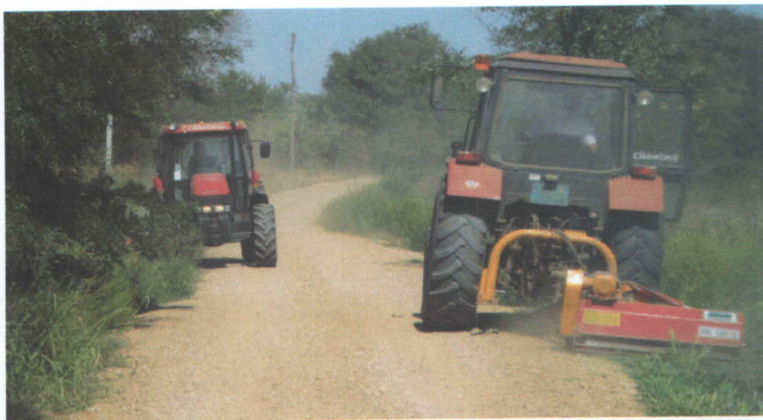
Slika 8. Mehaničko suzbijanje ambrozije –mašinsko košenje