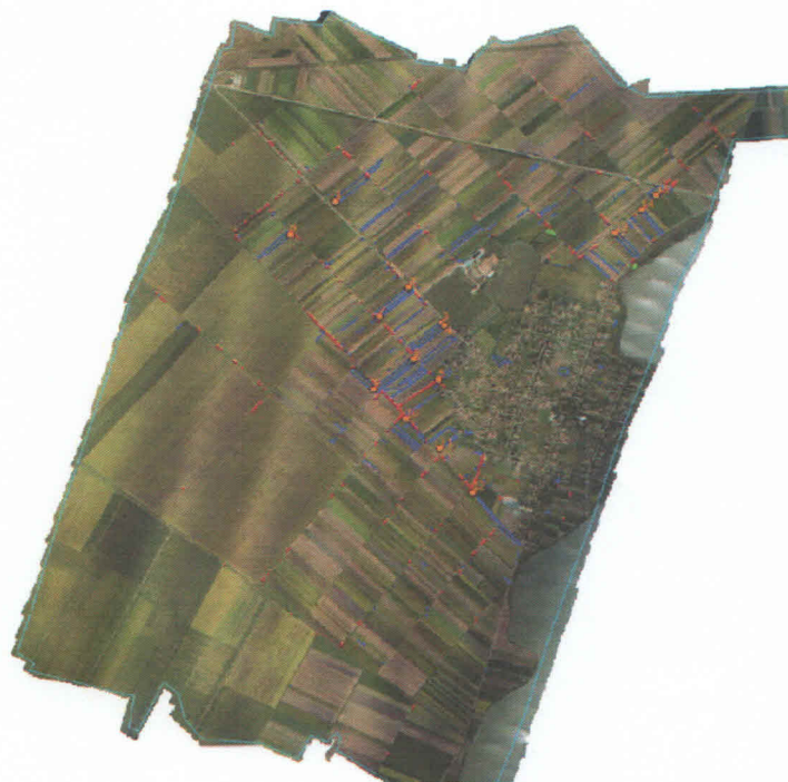
Slika 3. Daljinska detekcija površina pod ambrozijom – monitoring iz vazduha

Daljinska detekcija prostorne rasprostranjenosti ambrozije je sprovedena na 5 lokacija. Snimanje je sprovedeno 07.08.2018 godine iz helikoptera sa visine 400 metara od tla. Raspored dobijenih snimaka prikazan je na Slici 3. Površina sva tri snimljena lokaliteta iznosi 6.000ha.