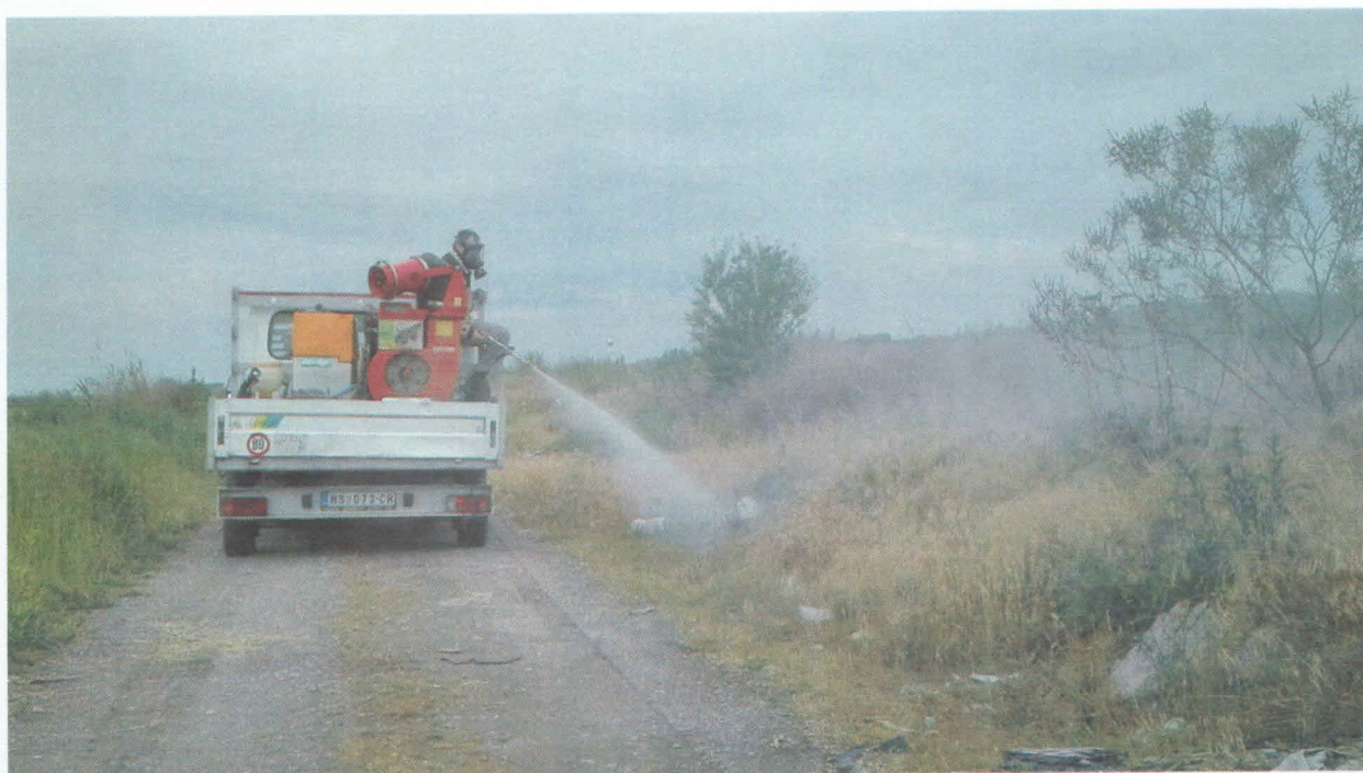
Slika 5. Tretman hemijskog suzbijanja ambrozije – Grad Zrenjanin

Na osnovu preporuke, izvršeno je hemijsko suzbijanje ambrozije na 35 lokacija na teritoriji Grada Zrenjanin (Aradac, Taraš, Elemir, Melenci, Belo Blaro, Stajićevo, Klek, Lukićevo, Lazarevo, Botoš, Orlovat, Knićanin, Perlez, Čenta, Farkaždin) i uništeno je ukupno 130.728 m 2 ambrozije . Radovi su bili sprovedeni u periodu od 28.05-10.06.2018.godine, Slika 5.