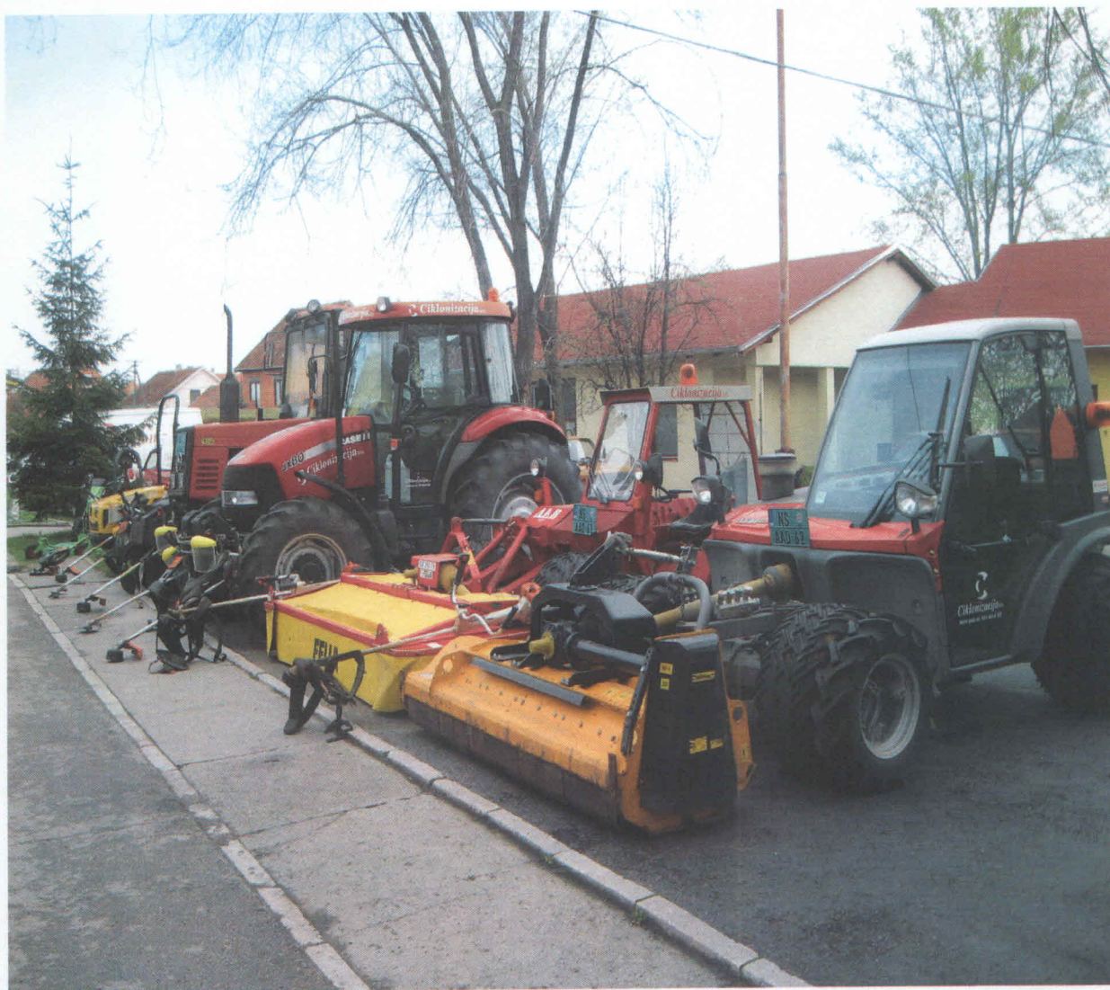
Slika 10. Mehanizacija Ciklonizacije A.d

Korišćeni ljudski resursi i mehanizacija bili su dovoljni da se u predviđenom vremenskom periodu urade svi tretmani predviđeni preporukom za rad, Slika 10. Na svim navedenim površinama uspešnost tretmana je 100 %.