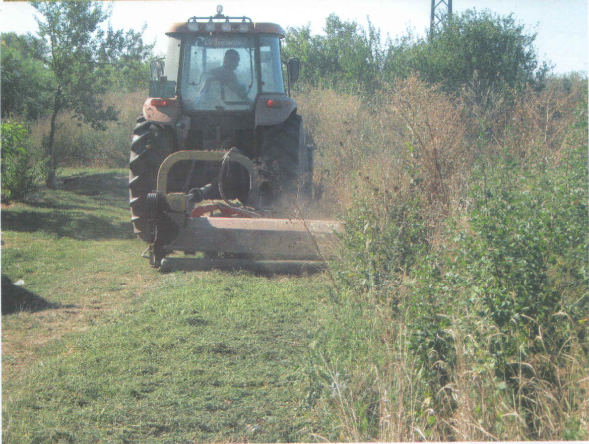
Slika 5. Mehaničko suzbijanje ambrozije – ručno i mašinsko košenje