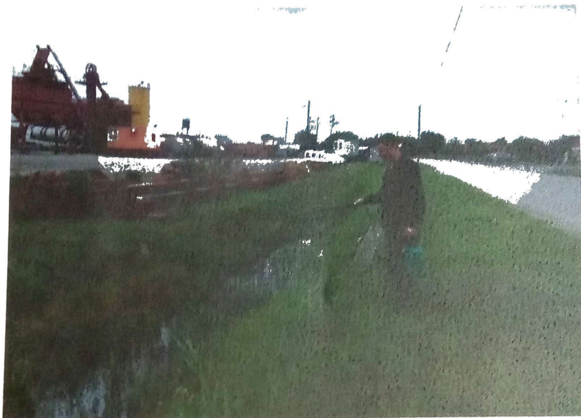
Slika 2. Larvicidni tretman kanala

Lokacije kao što su nezagađeni kanali, poila, kanali i bare sa utvrđenim prisustvom riba i vodozemca, tretirani su biološkim larvicidnim preparatom, bezopasnim po životnu sredinu. Takve lokacije na kojima je monitoringom utvrđeno prisustvo larvi komaraca operativci Ciklonizacije A.d tretirali su biološkim larvicidnim preparatom Vectobac 12AS, Slika 3.