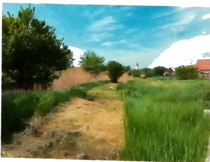
Slika 1. Pokošeni kanali

Ciklonizacija AD je u periodu od 08.06. – 09.06.2021.godine izvršila sanaciju terena – košenje kanala u Zrenjaninu gde visoka neprohodna trava i šiblje onemogućava prilaz operativcima za larvicidni tretman komaraca sa zemlje, Slika 1.