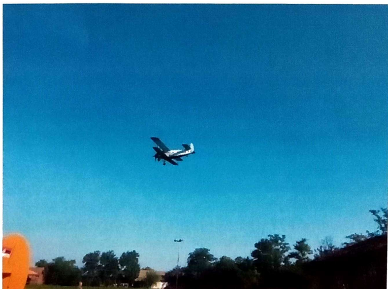
Slika 2. Tretman odraslih komaraca iz vazduha