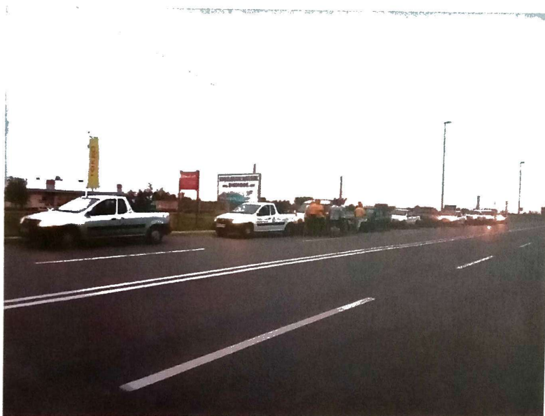
Slika 1. Tretman odraslih komaraca sa zemlje

U periodu od 01.06.-30.06.2021. godine , tretmani suzbijanja komaraca na teritoriji grada Zrenjanina su izvršeni na ukupnoj površini sa zemlje 9.765 ha , a iz vazduha na površini od 9.250 ha , Slika 1 i 2.