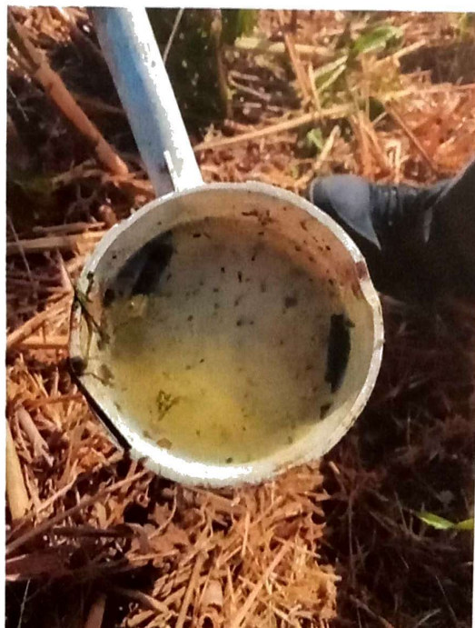
Slika 1. Monitoring larvi komaraca u Zrenjaninu

Ciklonizacija A.d otpočela je sprovođenje larvicidnog tretmana kanala i bara na teritoriji grada Zrenjanina. Na osnovu monitoringa i utvrđenog prisustva larvi komaraca operativci Ciklonizacije A.d su 03.06.-11.06.2021. godine sprovedi larvicidni tretman na teritoriji grada Zrenjanina sa zemlje, Slika 1. Tretman je vršen hemijskim larvicidnim preparatom Dimilin SC15 i biološkim larvicidnim preparatom Vectobac 12AS u cilju održavanja brojnost komaraca pod kontrolom, Slika 2.