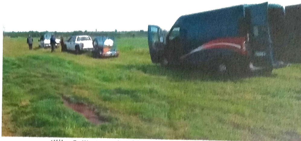
Slika 2. Tretman larvi komaraca iz vazduha Zrenjanin

Ciklonizacija AD je sproveda tretman larvi komaraca iz vazduha u priobalju Tise i Begeja 02.06.2021. godine na površini od 105 ha .