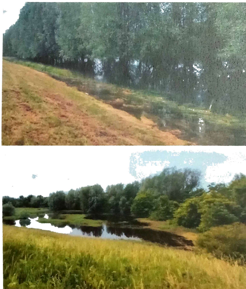
Slika 1. Monitoring larvi komaraca u Zrenjaninu

Ciklonizacija AD u cilju suzbijanja komaraca u larvenom stadijumu sprovela je monitoring izliva u priobalju Tise i Begeja na teritoriji grada Zrenjanina, Slika 1.