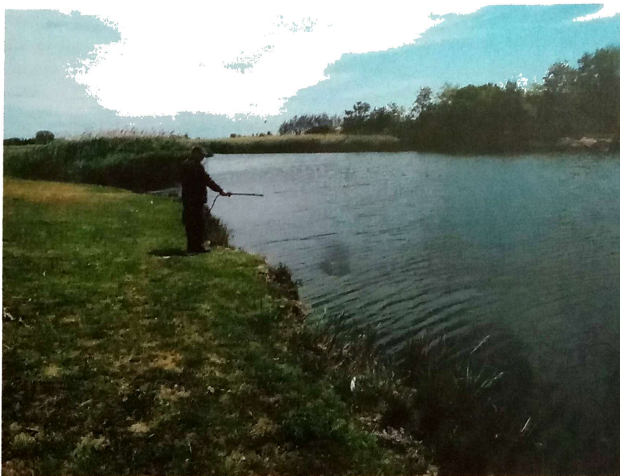
Slika 3. Biološki tretman larvi komaraca

Lokacije kao što su nezagađeni kanali, poila, kanali i bare sa utvrđenim prisustvom riba i vodozemca, tretirani su biološkim larvicidnim preparatom, bezopasnim po životnu sredinu. Takve lokacije na kojima je monitoringom utvrđeno prisustvo larvi komaraca operativci Ciklonizacije A.d tretirali su biološkim larvicidnim preparatom Vectobac 12AS, Slika 3.