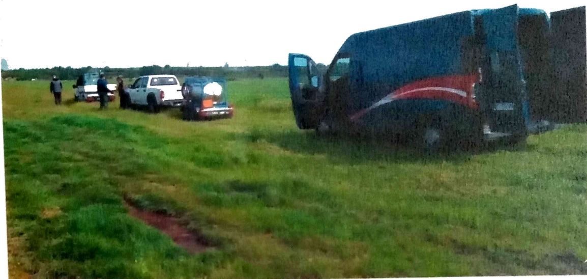
Slika 2. Tretman larvi komaraca iz vazduha Zrenjanin

Ciklonizacija AD, prvi tretman larvi komaraca iz vazduha u priobalju Tise sprovela je 15.05.2021. godine na teritoriji grada Zrenjanina na površini od 100 ha .