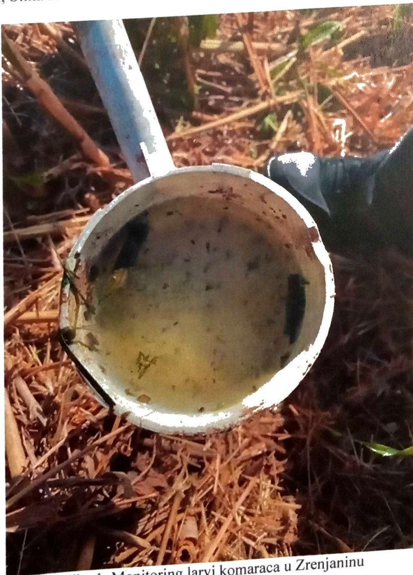
Slika 1. Monitoring larvi komaraca u Zrenjaninu

Ciklonizacija A.d otpočela je sprovođenje larvicidnog tretmana kanala i bara na teritoriji grada Zrenjanina. Na osnovu monitoringa i utvrđenog prisustva larvi komaraca operativci Ciklonizacije A.d su 06. - 11.05.2021. godine sproveli larvicidni tretman na teritoriji grada Zrenjanina sa zemlje, Slika 1. Tretman je vršen hemijskim larvicidnim preparatom Dimilin SC15 i biološkim larvicidnim preparatom Vectobac 12AS u cilju održavanja brojnost komaraca pod kontrolom, Slika 2.