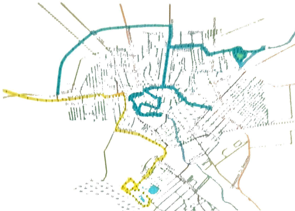
Slika 5. GPRS trek lokacija tretmana sa vode-amfibija

Prisustvom na terenu Ciklonizacija A.d pratiće nivo vode u kanalima i barama na teritoriji grada Zrenjanina. Ciklonizacija A.d će i u narednom periodu vršiti redovan monitoring i adekvatan larvicidni tretman komaraca gradu Zrenjanina.