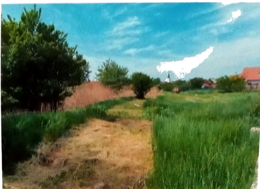
Slika 1. Pokošeni kanali

Ciklonizacija AD je u periodu od 26. – 28.05.2021. godine izvršila sanaciju terena košenje kanala u Zrenjaninu gde visoka neprohodna trava i šiblje onemogućava prilaz operativcima za larvicidni tretman komaraca sa zemlje, Slika 1.