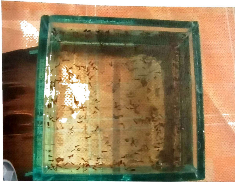
Slika 1. Larve komaraca

Operativci "Ciklonizacije" AD su dana 17. i 24.05.2021.godine vršili podelu BTI tableta na teritoriji grada Zrenjanina. BTI tablete su visoko selektivan biocidni proizvod koji deluje samo na larve komaraca, Slika 1. Tablete se koriste u domaćinstvima, tamo gde ima stajaće vode (septičke jame, kišničare, burad sa vodom, podrumi i dr.), a detaljno uputstvo za upotrebu i način doziranja nalazi se na svakom pakovanju tableta.