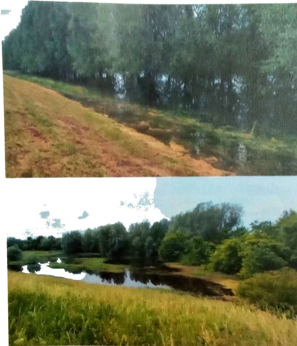
Slika 1. Monitoring larvi komaraca u Zrenjaninu

Ciklonizacija AD u cilju suzbijanja komaraca u larvenom stadijumu sprovela je monitoring izliva u priobalju Tise, Tamiša i Begeja na teritoriji grada Zrenjanina, Slika 1.