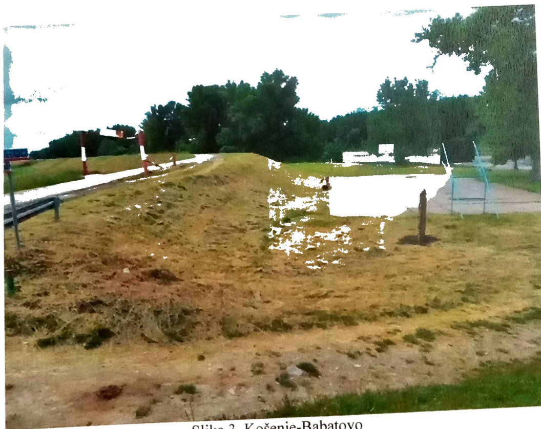
Slika 3. Košenje-Babatovo