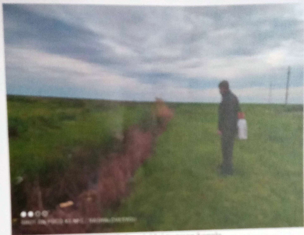
Slika 2. Larvicidni testman kamula

Lokacije kao što su nezagađeni kanali, pešča, kanali i bare sa utvrđenim prisustvom riba i vodnozomca, testirani su biološkim larvicidnom preparatom, bezopasnim po životnu sredinu. Takve lokacije na kojima je monitoringom utvrđeno prisustvo larvi komaraca operativci Cirkonizacije A.d testirali su biološkim larvicidnim preparatom Vectobac 12AS, Slika 3.