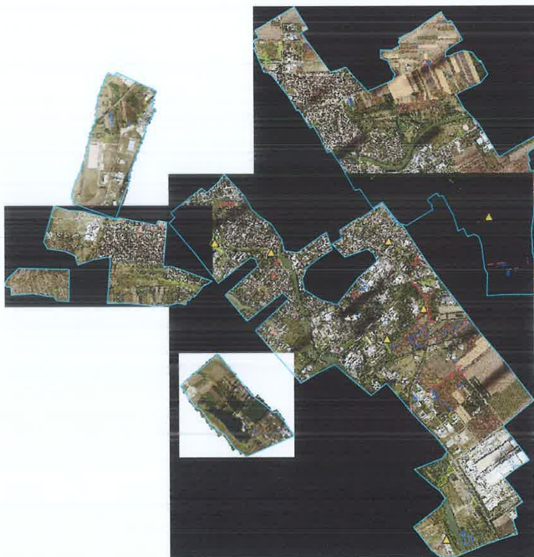
Slika 1. Prostorna raspodela ambrozije pre tretmana i divljih deponija. Crvenom bojom su predstavljene javne površine, dok su plavom bojom predstavljene privatne površine. Svetlozelenom bojom su predstavljene divlje deponije. Žutim trouglovima su predstavljene lokacije nekih od površina od interesa za stalni monitoring ambrozije (odlagališta zemlje, industrijske površine itd.).

Izvršeno je snimanje naselja na teritoriji grada Zrenjanina 20.09.2023. godine na 400 m visine od tla iz helikoptera Bell 206B3. Prostorna rezolucija snimaka iznosi 10 cm/pixel. Izvršeno je snimanje grada Zrenjanina sa okolinom. Zahtevana ukupna površina snimaka po ugovoru iznosi 2000 ha, što ujedno predstavlja i minimalnu površinu. Maksimalna celokupna površina snimaka uokvirena svetloplavim poligonima iznosi 2760 ha.