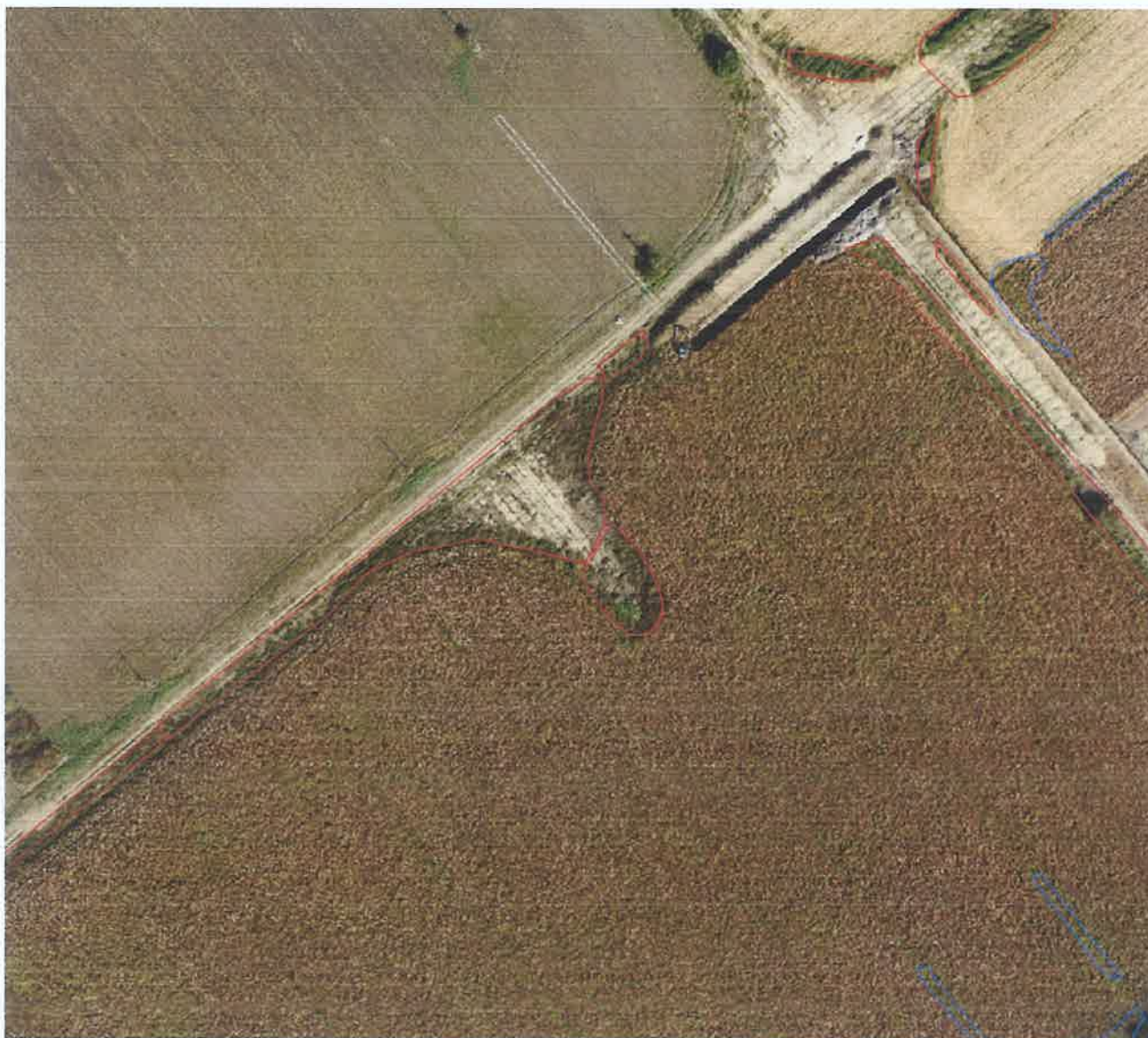
Slika 5. Snimak ambrozije u okolini naselja Zrenjanin pored atarskog puta u industrijskoj zoni gde je bio stari aerodrom. Javna površina je obeležena crvenim poligonom.