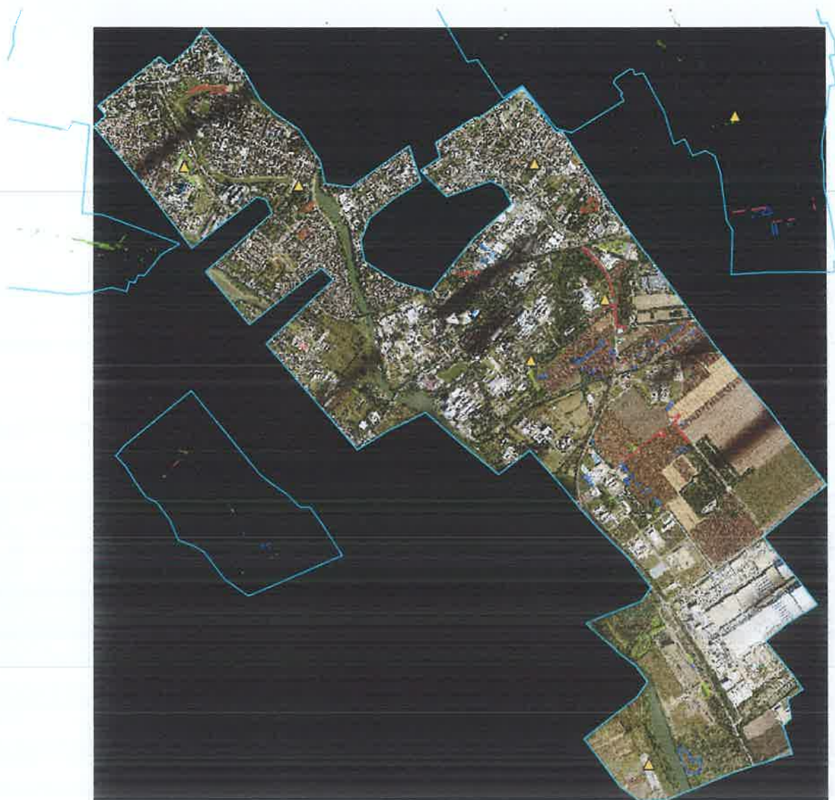
Slika 3. Prostorna raspodela ambrozije pre tretmana i divljih deponija. Snimak „2023_09_20 Ambrozija Grad Zrenjanin 04“.