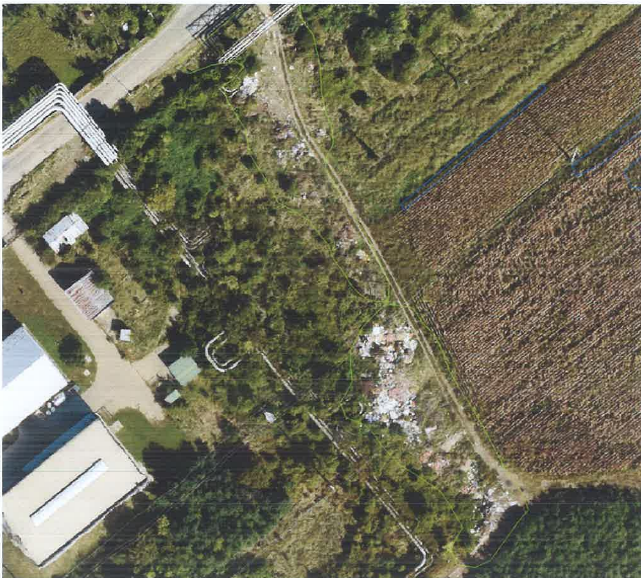
Slika 6. Snimak divlje deponije u naselju Zrenjanin (Šećeranska ulica). Površine su obeležene svetlozelenim poligonima.