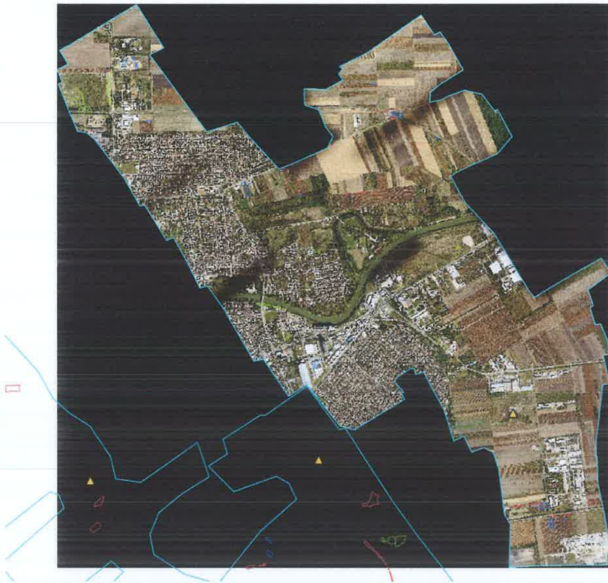
Slika 4. Prostorna raspodela ambrozije pre tretmana i divljih deponija. Snimak „2023_09_20 Ambrozija Grad Zrenjanin 05”.