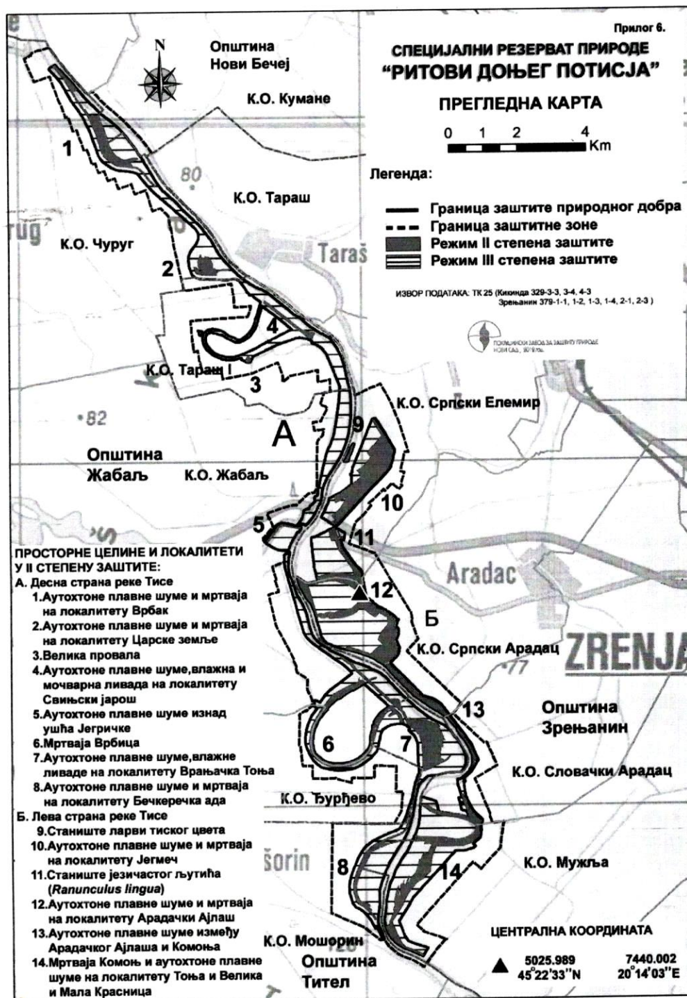
Слика 1: Специјални резерват природе „Ритови доњег Потисја“