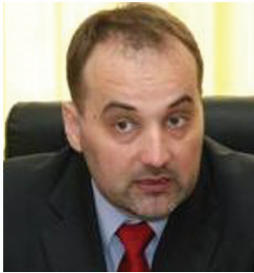
Заштитник грађана Саша Јанковић