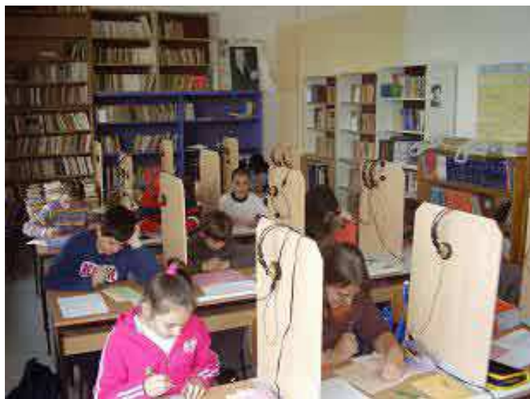
Основна школа у Б.Деспотовцу