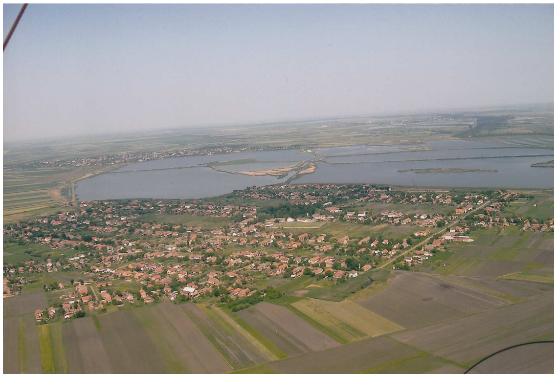
ПОГЛЕД НА СЕЛО И РИБЊАК ИЗ ВАЗДУХА