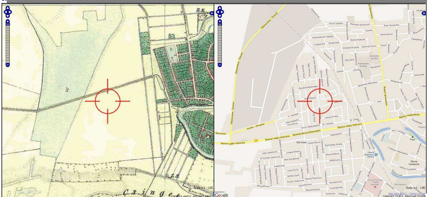
Mesna zajednica 2015. godine