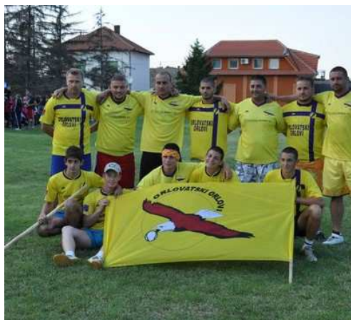
Слика 3. Петоструки Светски прваци у шорама

Када се говори о специфичностима у Орловату морају се споменути још две ствари, а то су „ лопте на шорање “ и карташка игра „ Фукс “. Лопте на шорање се до 60-тих година XX века играју у пролеће скоро сваког сунчаног дана, а задњих година само на први дан Ускрса и за време манифестација Дани Уроша Предића и Дан Месне Заједнице. Игра окупља велики број играча и публике, а игра се да две екипе тако што се палицом шора крпена лопта. Лопте на шорање има сличности са бејзболом и одувек се играла у Орловату. Орловат је петоструки Светски првак у „шорама“, како ову игру називају у Томашевцу, који је уједно и организатор Светског Првенства. „Фукс“ је карташка игра која се игра са мађарским картама – 32 карте. Игра се са 2+2 картароша, има специфична правила, а нарочито писање. Није познато да се још негде игра, а у Орловату је једна од најомиљенијих забава у току целе године. Лети на сокаку окупља бучну публику око играча.