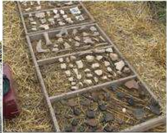
Слика 7. Археолошке ископине