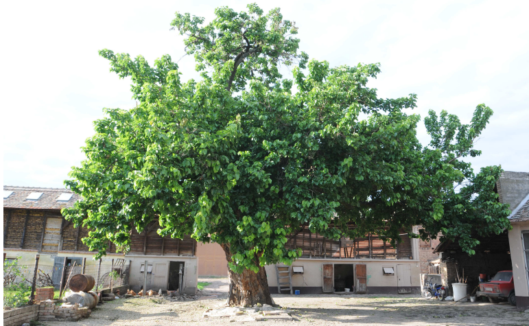
Слика 5: Дуд Уроша Предића

Света водица орловатска – посвећена је летњем Св. Арханђелу, а озидана је 1936. Године са ископаним бунаром у њој. Верује се да ова света водица из бунара има лековиту моћ, а доказано је да има лековито својство за вид.