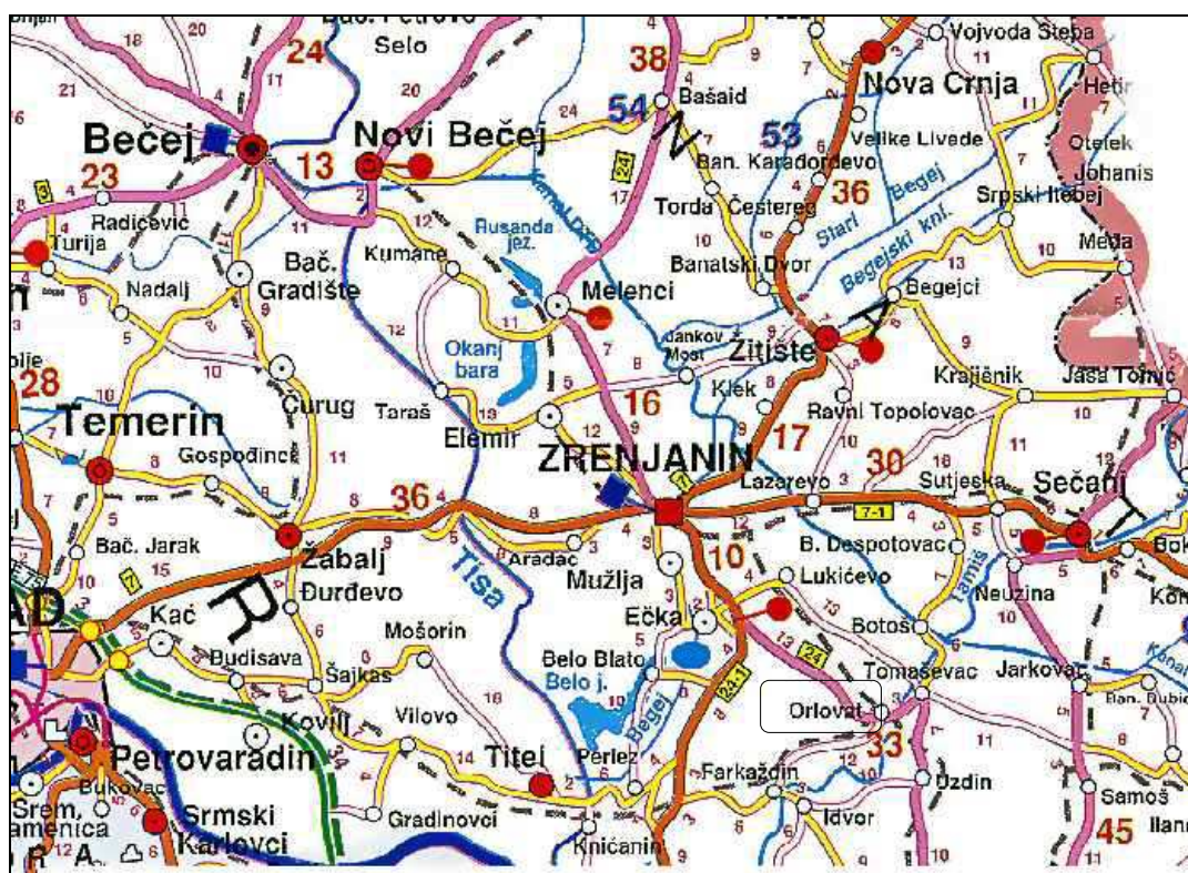
Слика1. Приказ ауто-карте и положаја села Орловата

Орловат се налази двадесетак километара југо-источно од Зрењанина ка Панчеву. Катастарска општина Орловат обухвата површину од 4246 ха 65 а и 46 м2. Смештено је на вишој тамишкој тераси апсолутне висине 81метара. Целом својом дужином са једне стране прислоњено је уз дењу обалу реке Тамиш, а са друге стране уз лесни плато који благо прелази у алувијалну раван. Лесни плато код Орловата достиже висину од 99метара апсолутне висине и својом висином доминира у средњем Банату. Ту се налази јединствена геодетска пирамида подигнута почетком 20. Века. По лепом дану са ње се види Вршачки брег, Фрушка гора и Авала. Место Орловат је повезано са Зрењанином магистралним путем М-24 који се даље пружа преко Томашевца ка Панчеву. На домаку насеља рачвају се путни правци за Београд и Нови Сад. Од Београда Орловат је удаљен 75 км, од Новог Сада 70 км, а од Панчева 45 км. Орловат је раскрсница ћелезничких пруга за правце Зрењанин, Београд и Нови Сад те му је у том смислу положај веома повољан и издваја га од осталих насељених места општине.