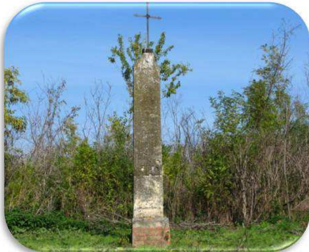
Слика 4. Споменик Капетану Ђорђу Радивојевићу

На десној обали Тамиша поред летњег пута Орловат-Ботош налази се споменик који је подигнут 1823. Године царском капетану Ђорђу Радивојевићу . Капетан Радивојевић је као аустријски официр учествовао у рату против Турака и 1788. Године је на месту где се данас налази споменик погинуо заједно са 300 чланова своје посаде.