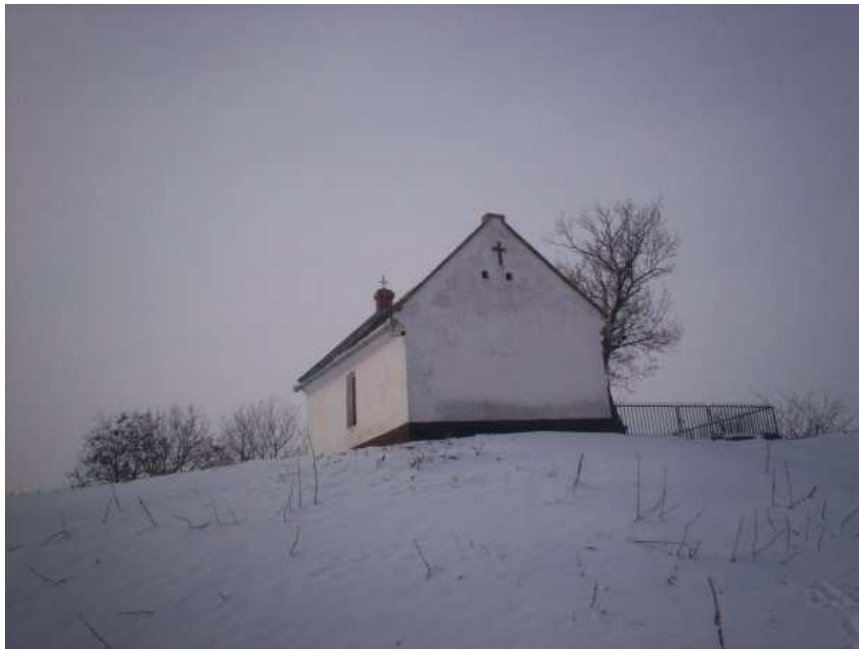
Слика 6. Света Водица Орловатска

Света водица орловатска – посвећена је летњем Св. Арханђелу, а озидана је 1936. Године са ископаним бунаром у њој. Верује се да ова света водица из бунара има лековиту моћ, а доказано је да има лековито својство за вид.